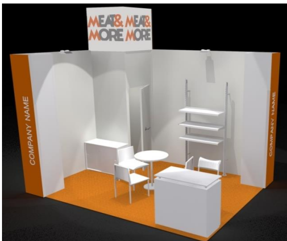
Stand preallestito 12 mq